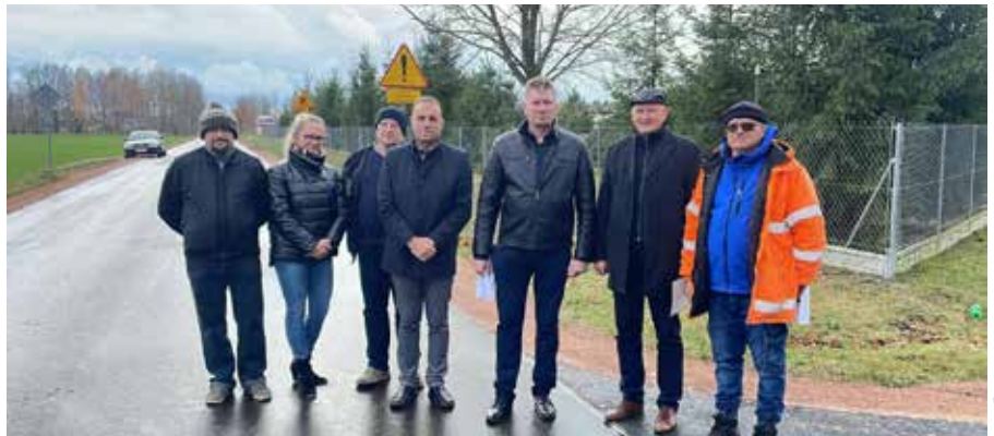
For: Radio Biper