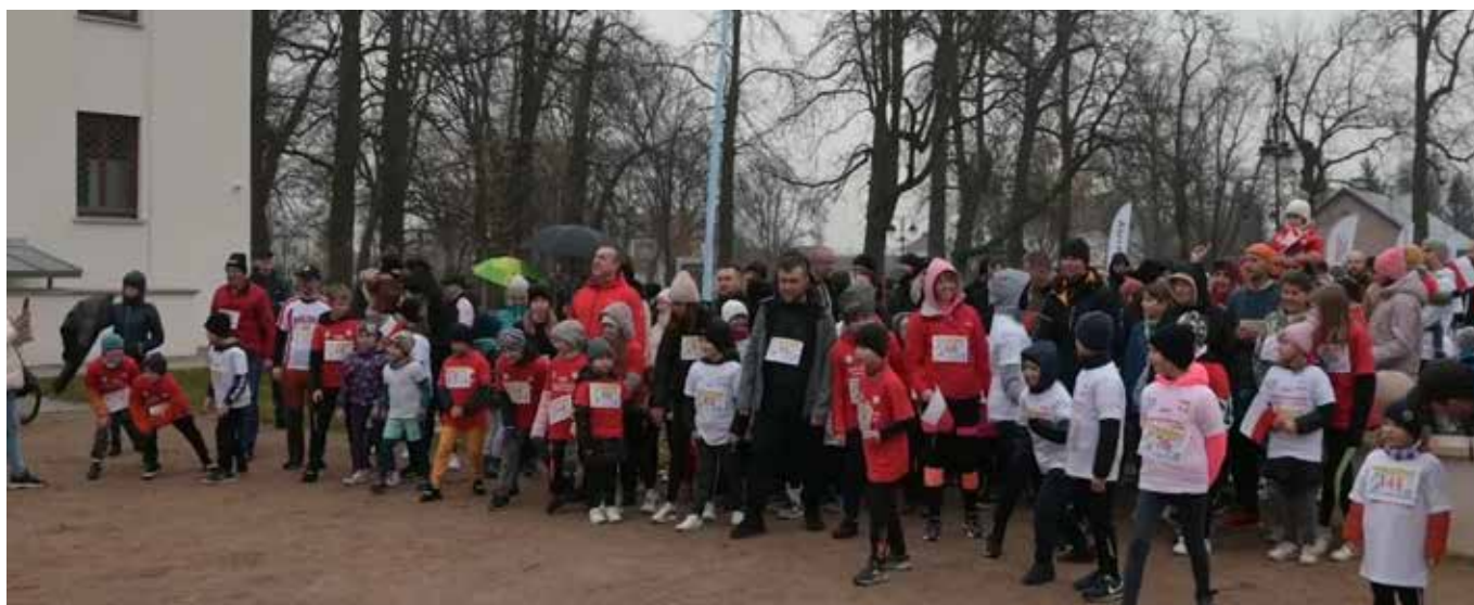
Fot. Radio Biper

Materiał: Radio Biper / Międzyrzec Podlaski