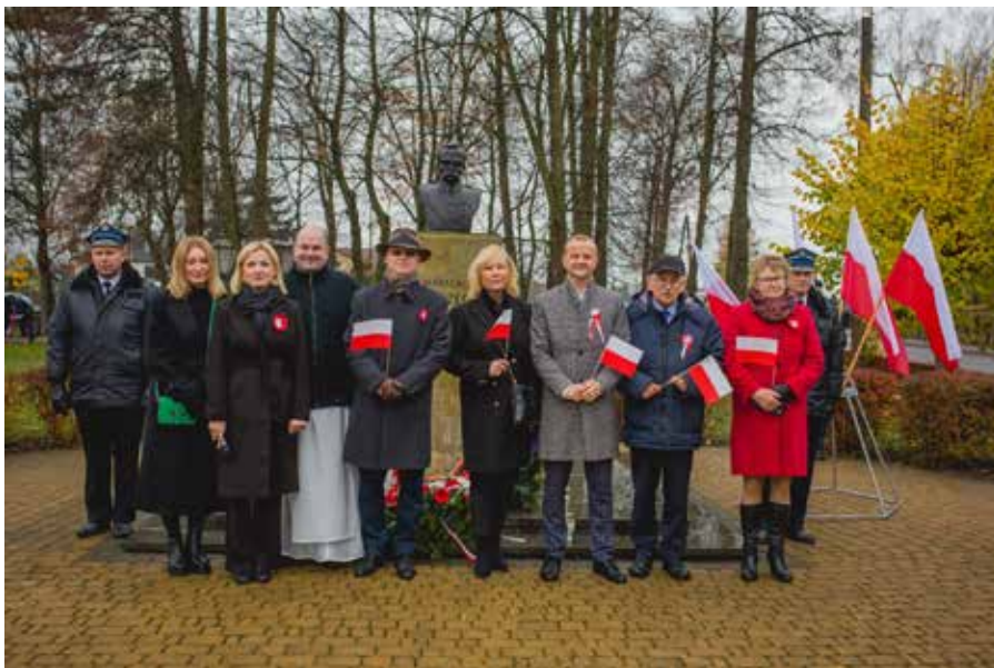
Fot. Radio Biper

Radio Biper / Gmina Leśna Podlaska/ UG Leśna Podlaska