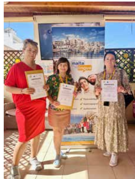
Materiał: Radio Biper Międzyrzec Podlaski