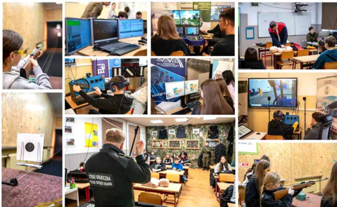
Fot. Małgorzata Trębicka-Złak, Szymon Kiryczewski Zespole Szkół im. Wł. St. Reymonta w Małaszewiczach

Materiał: Zespole Szkół im. Wł. St. Reymonta w Małaszewiczach