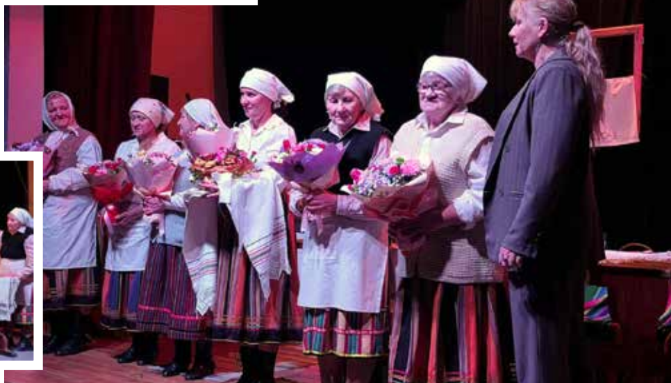
Fot. Jerzy Gazan