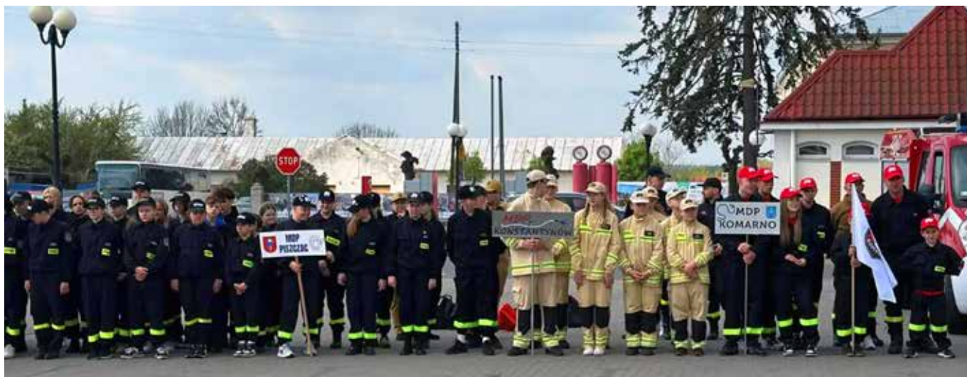
Fot. Bartek Sawa Sawicki

Materiał: Radio Biper Gmina Janów Podlaski