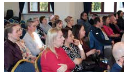
For. Radio Biper