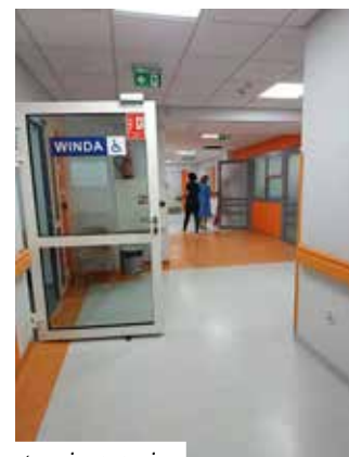
Zmodernizowane pomieszczenia oddziału rehabilitacji