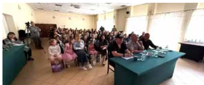
Fot. Bartek Sawa Sawicki