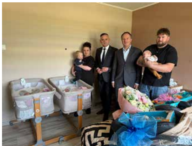
For: Starostwo Powiatowe w Białej Podlaskiej

liwości wobec rodziców stojących przed nowym, niezwykle wymagającym, ale i pięknym etapem życia.